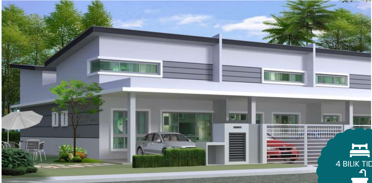
RUMAH TERES SATU TINGKAT