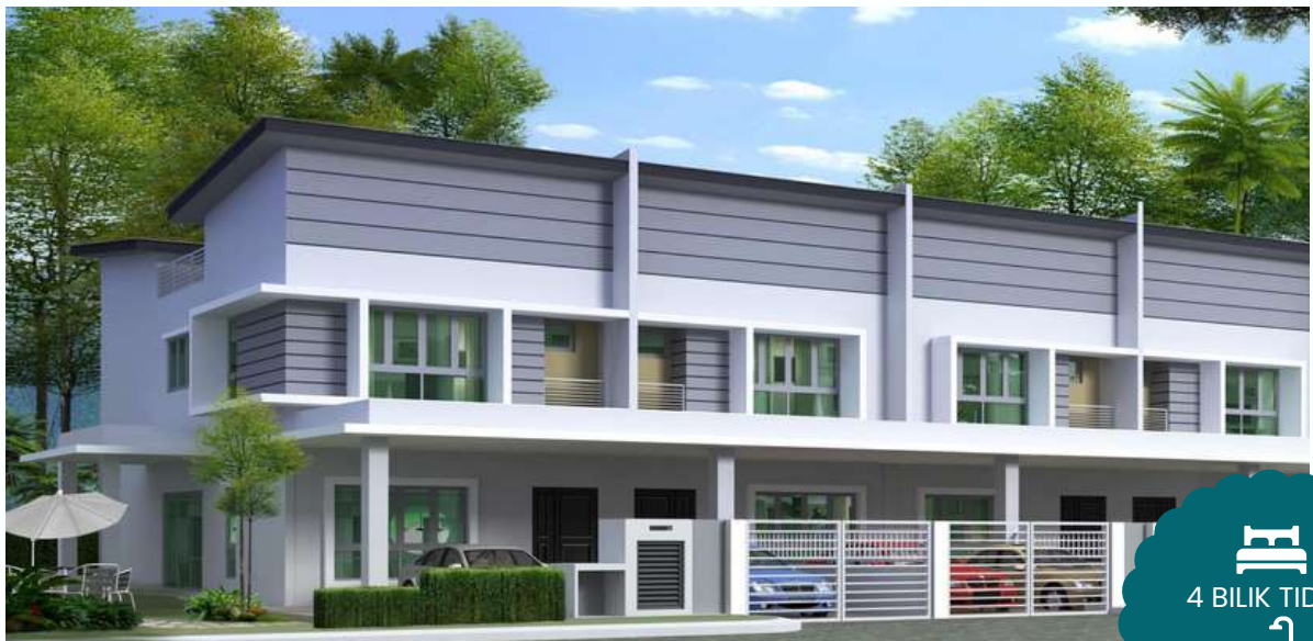
RUMAH TERES DUA TINGKAT