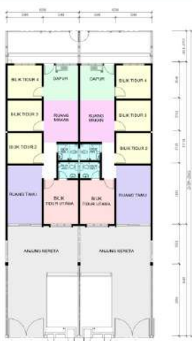
Pelan Aras Tingkat Bawah